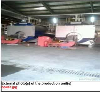
External photo(s) of the production unit(s) boiler.jpg