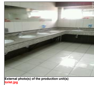
External photo(s) of the production unit(s) toilet.jpg