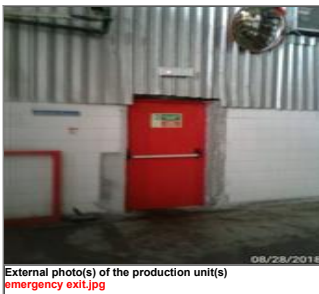
External photo(s) of the production unit(s) emergency exit.jpg