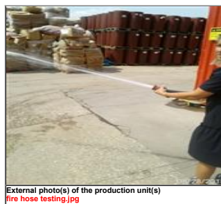
External photo(s) of the production unit(s) fire hose testing.jpg