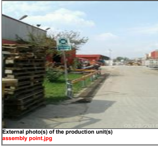
External photo(s) of the production unit(s) assembly point.jpg