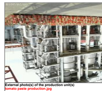
External photo(s) of the production unit(s) tomato paste production.jpg