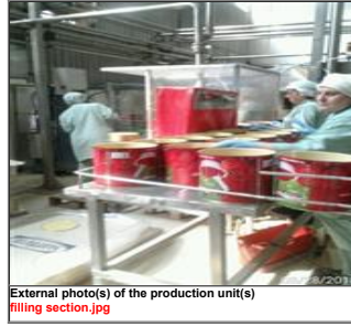
External photo(s) of the production unit(s) filling section.jpg