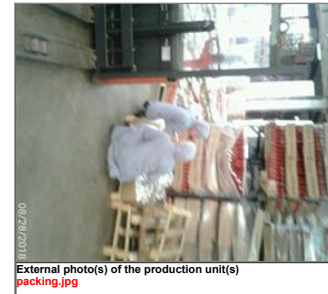
External photo(s) of the production unit(s) packing.jpg