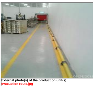
External photo(s) of the production unit(s) evacuation route.jpg