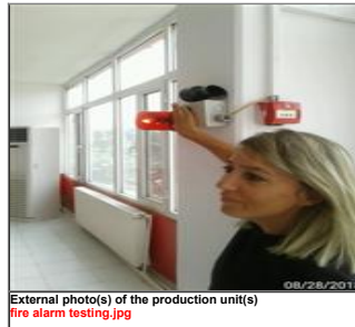
External photo(s) of the production unit(s) fire alarm testing.jpg