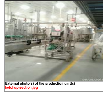
External photo(s) of the production unit(s) ketchup section.jpg