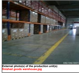
External photo(s) of the production unit(s) finished goods warehouse.jpg