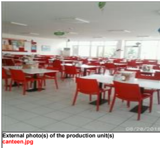
External photo(s) of the production unit(s) canteen.jpg